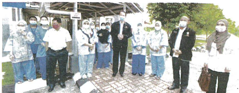
NOOR HISHAM melakukan tinjauan keselamatan Pusat Kuarantin dan Rawatan Covid-19 Berisiko Rendah (PKRC) di Politeknik Port Dickson, semalam.

Beliau berkata, sebanyak 49 kluster melaporkan pertambahan kes semalam dengan kes tertinggi di Kluster Tapak Bina Bulatan sebanyak 162 yang menjadi penyumbang utama kepada peningkatan kes di Kuala Lum-