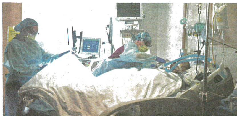
Petugas kesihatan di Hospital UMass Memorial Worcester, Massachusetts, Amerika Syarikat memberi rawatan kecemasan kepada pesakit COVID-19.

Ketua Pengarah WHO, Tedros Adhanom Ghebreyesus, berkata kemajuan pembangunan vaksin itu memberi kelegaan dan kini, 'cahaya di hujung terowong' su-