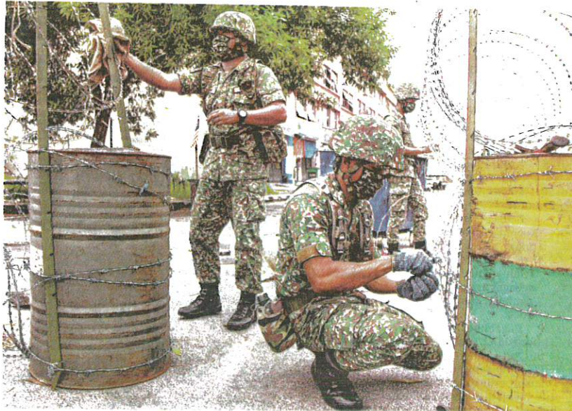
ORANG ramal boleh melakukan pergerakan rentas negeri tanpa kebenaran polis kecuali di kawasan yang dikenakan perintah PKPD. – GAMBAR HIASAN

Kata beliau, keadaan ini akan mengakibatkan kemerosotan pasaran buruh, penurunan perbelanjaan isi rumah, peningkatan ketidaktentuan pelaburan, kehilangan pekerjaan tetap dan