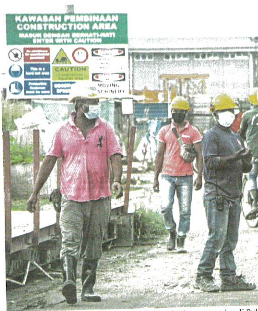
Ujian saringan terhadap kira-kira 127,000 pekerja warga asing di Pulau Pinang telah dijalankan secara berperingkat.

"Jumlah kluster aktif yang dipantau sebanyak 187 kluster.